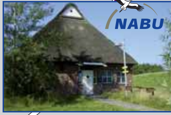
NABU Naturzentrum Scholenfleth Öffnungszeiten: April bis Sept., So 11-16 Uhr

Die „Pinneberger Elbmarschen“ sind zudem in die Liste der „Bedeutenden Vogelschutzgebiete“ (Important Bird Area IBA) aufgenommen. Die Naturschutzgebiete sind zudem nach der EU-Vogelschutz- und der Fauna-Flora-Habitat-Richtlinie geschützt. Sie sind damit Teil des gesamteuropäischen Netzes von NATURA 2000.