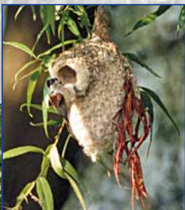
Beutelmeise am Nest

In den Naturschutzgebieten der Pinneberger Elbmarsch wird eine einmalige Flussuferlandschaft geschützt. Vier Mal am Tag ändert sich mit Ebbe und Flut die Fließrichtung des Wassers und die Wasserstände zwischen Niedrigwasser und Hochwasser. Es entstand ein amphibischer Lebensraum: Ein Ästuar. Die normalen Tiden werden häufig durch Sturmfluten überlagert. Extreme Hochwasserstände und starke Wasserdynamik sind die Folge.