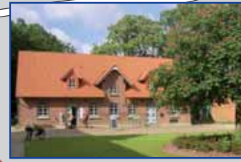
Elbmarschenhaus Tel. 04129/95549490 Öffnungszeiten: tägl. 10-16 Uhr