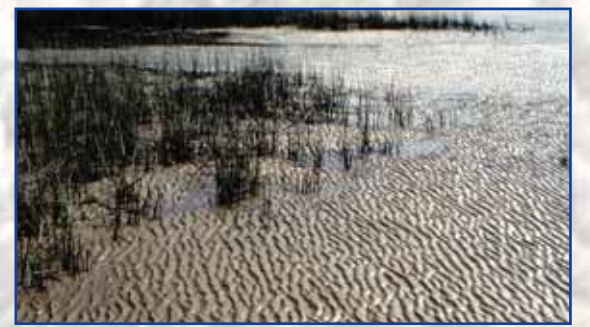
Süßwasserwattfläche mit Binsen

Parallel zum Ufer ist im gesamten Ästuar eine deutlich erkennbare Zonierung der Lebensräume entstanden. Direkt am Fluss ist bei Niedrigwasser ein breiter Streifen vegetationsfreier Wattflächen zu sehen. Es folgen eine schmale Zone mit Binsen und ausgedehnte Schilfbestände. Weiter zum Land hin wachsen krautige Blütenpflanzen, die schließlich in ein Weidengebüsch übergehen. Die unterschiedlichen Lebensräume werden von Arten besiedelt, die mit der Wasserdynamik im Ästuar leben können. Landtiere können Überflutungen, Wassertiere das Trockenfallen kurzfristig ertragen. Arten wie Vögel oder Fische sind sehr gut beweglich und weichen aus.