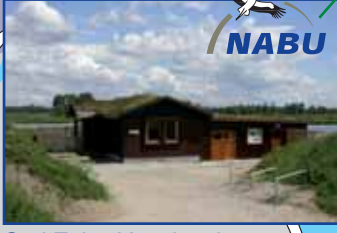
Carl Zeiss Vogelstation Öffnungszeiten: Mi, Do, Sa, So und Feiertage 10-16 Uhr