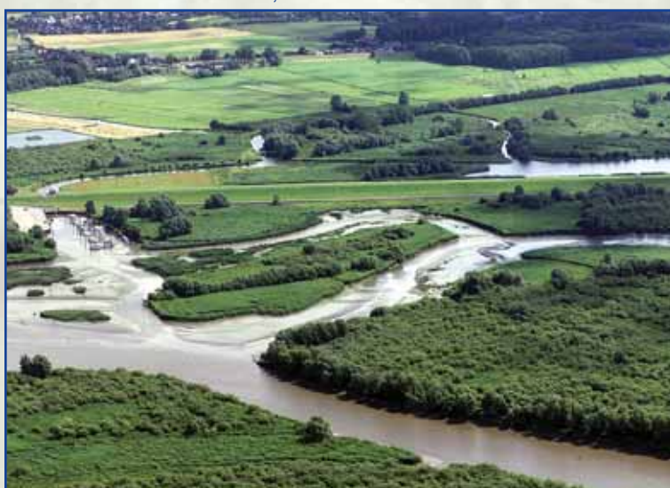
Blick auf Ästuar, Deich und Haseldorfer Binneneibe

Der Hauptdeich kann in seiner gesamten Länge betreten werden. Man kann aus etwa 8 Metern Höhe weit in die Flächen hineinsehen und Tiere beobachten. Außerhalb der gekennzeichneten Wege darf das Naturschutzgebiet nicht betreten werden. Denn nur wenn der Mensch nicht stört, lassen sich Tiere aus der Nähe beobachten.